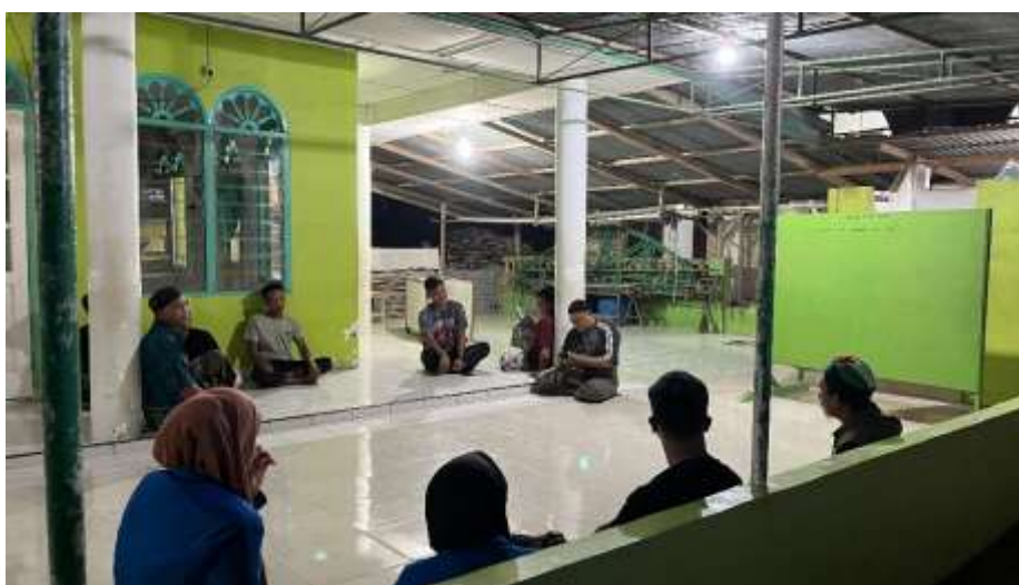
Gambar 1.3 Diskusi Bersama Remaja Masjid dan Ketua DKM Masjid Al Barakah

Selain itu mahasiswa juga turut serta dalam aspek sosial dan keagamaan. Mereka berperan dalam pembinaan remaja masjid serta mengadakan perlombaan Tahfidz Qur'an untuk meningkatkan semangat keislaman di kalangan anak-anak dan remaja. Kendala utama yang dihadapi adalah kurangnya partisipasi remaja masjid akibat rendahnya kesadaran terhadap pentingnya aktivitas keagamaan. Dalam wawancara dengan Ketua DKM Masjid Al-Barakah, beliau menuturkan, "Kami mengapresiasi upaya mahasiswa dalam menggerakkan kembali kegiatan remaja masjid yang selama ini kurang aktif. Diharapkan program ini bisa terus berlanjut meskipun mahasiswa sudah kembali ke kampus."