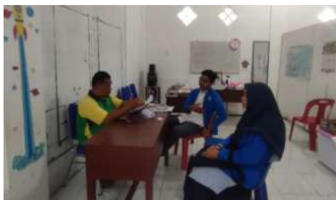
Gambar 1.2 Wawancara Mahasiswa dengan Kadus Paya Lombang

Salah satu permasalahan utama yang dihadapi UMKM di Desa Paya Lombang adalah kurangnya pemahaman dalam pencatatan keuangan dan pengelolaan usaha yang efektif. Mahasiswa yang mengikuti program KKL membantu memberikan pelatihan tentang pembukuan sederhana, perencanaan modal, serta strategi pemasaran berbasis digital. Kepala Desa Paya Lombang, , dalam wawancara menyampaikan bahwa keterlibatan mahasiswa sangat membantu para pelaku usaha kecil dalam memahami pentingnya manajemen keuangan. "Banyak warga di sini menjalankan usaha secara turun-temurun tanpa pencatatan yang baik. Dengan bimbingan mahasiswa, mereka mulai memahami bagaimana mengelola keuangan usaha secara lebih sistematis dan mahasiswa mengedukasi bahwa usaha perlu memiliki NPWP," ujar beliau.