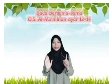
Gambar 5. Instruksi mengaji

Tahapan ketiga yaitu proses editing. Setelah tahap story line, dilanjutkan dengan tahap editing yang menggunakan aplikasi pinterest dan capcut . Adapun pada proses editing video dilakukan menggunakan aplikasi capcut dan aplikasi pinterest digunakan untuk mencari berbagai animasi yang dibutuhkan dalam proses editing video pembelajaran. Video pembelajaran dibuat dengan tampilan semenarik mungkin dan penggunaan bahasa yang mudah dipahami yang berisi materi pembahasan dan pertanyaan. Adapun penyusunan isi