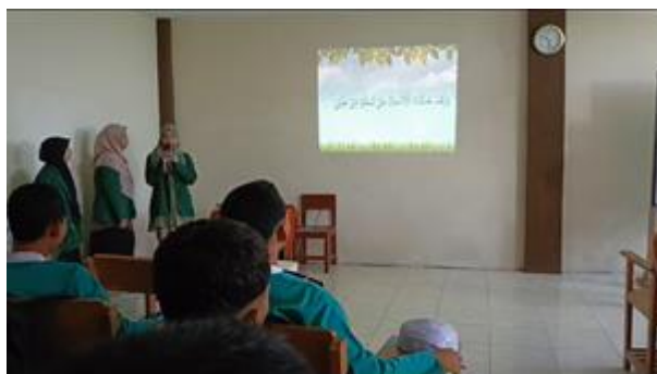
Gambar 6. Iplementasi produk dikelas

Pada tahap ini peneliti menerapkan media video pembelajaran interaktif yang telah divalidasi dan diperbaiki untuk diujicobakan kepada peserta didik. Tahapan ini bertujuan untuk mengetahui apakah video pembelajaran interaktif yang telah dikembangkan telah sesuai dengan kebutuhan para peserta didik dan dapat membantu dalam proses pembelajaran. Uji coba ini dilakukan di kelas XI dengan jumlah siswa 23 orang serta 1 guru Al-Qur'an hadis yang melakukan pengawasan.