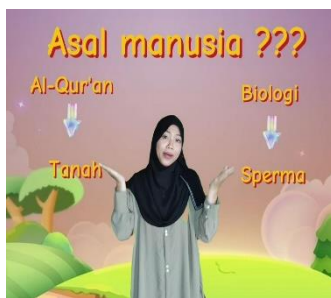
Gambar 3. Pertanyaan pemantik

Pada tahap kedua dilakukan perekaman video dengan background hijau agar dapat diedit dengan berbagai animasi yang sesuai. Penggunaan mic juga diperlukan dalam proses perekaman video agar suara menjadi lebih jelas. Perekaman video dilakukan berdasarkan story line yang telah dibuat.