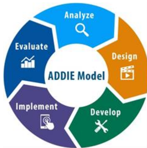
Gambar 1. Tahap model ADDIE

Langkah-langkah model ADDIE meliputi, Analisis, Design, Development, Implementation dan Evaluation. Penjelasan lebih lanjut yaitu sebagai berikut: