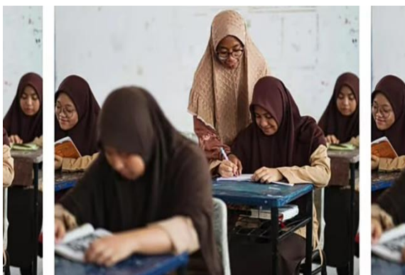
Gambar 1. Salah satu gambar ilustrasi terkait materi

Maka dari itu, berdasarkan hasil angket respon siswa dan guru dapat disimpulkan bahwa media pembelajaran berbasis multimedia interaktif yang telah dikembangkan oleh peneliti memperoleh respon baik dalam pembelajaran Akidah akhlak pada materi bab dua yaitu “Akhlak Terpuji Kepada Diri Sendiri” di kelas IX MTs Islamiyah Palangka Raya.