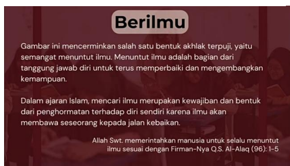
Gambar 2. Deskripsi materi terhadap gambar ilustrasi