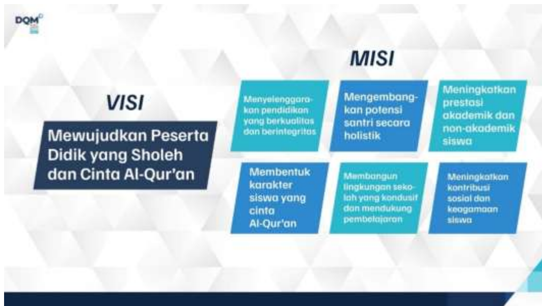
Gambar 2 Visi Misi Pesantren

Dalam mewujudkan visi dan misi pendidikan, sebuah lembaga pasti memerlukan struktur organisasi yang jelas, terarah, dan saling mendukung. Struktur organisasi berperan sebagai pedoman dalam mengatur pembagian tugas, wewenang, serta tanggung jawab setiap pihak yang terlibat. Dengan adanya struktur organisasi yang baik, proses pembelajaran dan pembinaan santri dapat berlangsung lebih efektif, terkoordinasi, serta sesuai dengan tujuan lembaga.