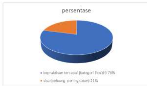
Gambar 1. Respon Angket Mahasiswa Berdasarkan Indikator

Ket : Indikator di tampilkan dengan nomor sesuai dengan tabel 4