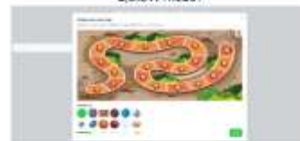
Gambar 5. Mengkreasikan Map QuizWhizzer