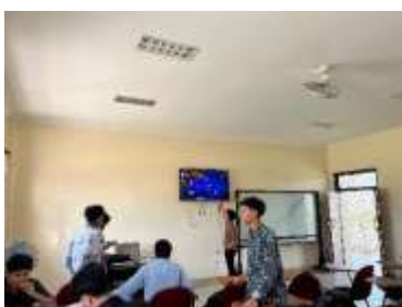
a) Menjelaskan Tata cara Bermain Game QuizWhizzer

Tahap implementasi dilakukan dalam dua sesi, yaitu pengenalan media dan pelaksanaan kuis. Sebanyak 29 mahasiswa PAI kelas C angkatan 2023 dilibatkan dalam kegiatan ini. Pada sesi pertama, mahasiswa diperkenalkan dengan tata cara bermain dan sistem poin pada QuizWhizzer. Pada sesi kedua, mahasiswa dibagi menjadi kelompok kecil untuk bermain menggunakan laptop dan ponsel masing-masing. Dosen berperan sebagai fasilitator yang memantau aktivitas dan waktu penyelesaian kuis. Berdasarkan observasi, mahasiswa menunjukkan antusiasme tinggi, suasana belajar menjadi lebih hidup, dan terdapat peningkatan interaksi antar mahasiswa.