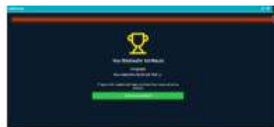
Gambar 7. Tampilan Setelah Menyelesaikan Semua Soal QuizWhizzer