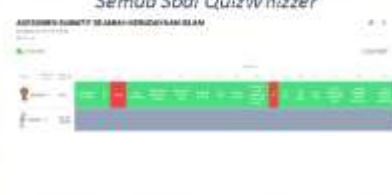
Gambar 9. Tampilan Skor Hasil Akhir dan Waktu Bermain QuizWhizzer