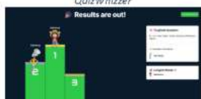
Gambar 8. Papan Skor Peringkat dalam QuizWhizzer