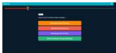
Gambar 6. Tampilan Soal dalam Game QuizWhizzer

Pada tahap ini, media QuizWhizzer dikembangkan melalui situs resmi https://www.quizwhizzer.com . Peneliti membuat akun, mengunggah pertanyaan yang telah disusun, dan mengatur tampilan papan permainan (game board) agar sesuai dengan tema sejarah Islam. Media kemudian divalidasi oleh dua dosen ahli dari Fakultas Tarbiyah dan Ilmu Keguruan (FTIK) UINPr, masing-masing sebagai ahli media dan ahli materi. Hasil validasi menunjukkan bahwa media memperoleh 78% dari ahli media dan 80% dari ahli materi, sehingga dikategorikan “Layak digunakan”.