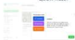
Gambar 4. Jenis Game dalam QuizWhizzer