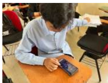
b) Mahasiswa Bermain Game QuizWhizzer