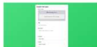
Gambar 3. Proses Input Soal dalam QuizWhizzer