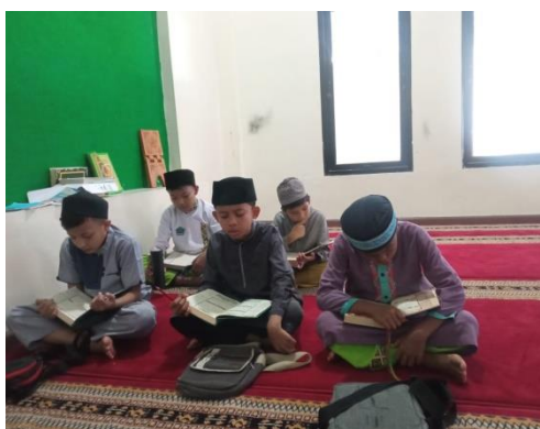
Gambar 2: Proses Pembelajaran Tahsin

Secara keseluruhan, implementasi program berjalan sesuai rencana, dengan pelibatan aktif guru, santri, dan orang tua. Setiap tahap dalam pelaksanaan difokuskan pada peningkatan ketepatan pelafalan huruf-huruf Al-Qur'an sesuai dengan makharijul huruf, serta membangun kesadaran santri tentang pentingnya aspek ini dalam membaca Al-Qur'an.