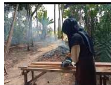
Gambar.8 Penghalusan papan