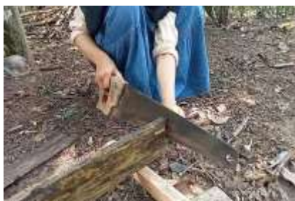
Gambar.7 Pemotongan papan no RT

Dalam proses ini papan di potong menggunakan gergaji dengan ujung sebelah kanan dan di kiri di buat bentuk panah sesuai arah penempatan perbatasan dengan Panjang 30 cm, Kemudian di haluskan dengan alat penghalus kayu agar lebih halus serta mudah untuk pengecatan.