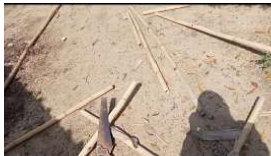
Gambar. 6 Pemotongan bambu