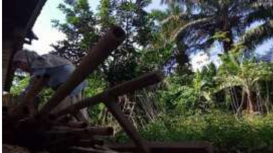
Gambar.3 Pemilahan bambu

Dalam proses ini, bambu di pilah untuk melihat bambu mana yang paling layak untuk digunakan. Pembuatan plang pembatas RT menggunakan bambu yang sudah tua dan kering agar bambu tahan lama dan mudah dalam proses pengecatan.