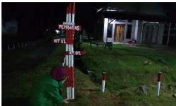
Gambar 13. Pemasangan plang pembatas RT