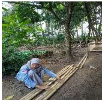
Gambar.5 Penyambungan bambu

Dalam proses ini bambu di potong dengan menggunakan gergaji dan alat pemotong kayu(Circular Saw) dengan masing masing bambu berukuran 190 cm dengan satu plang ber isi 3 bambu yang di rekatkan satu sama lain. Kemudian ujung atas bambu di potong miring dengan ukuran yang berbeda, agar menambah kesan variasi.