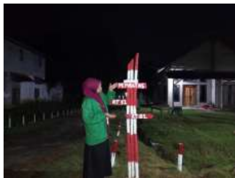
Gambar 14. Plang telah berhasil di pasang

Setelah melaksanakan kegiatan pemasangan plang pembatas RT di Desa Suka Maju Dusun 03, maka hasil yang di peroleh Mahasiswa (Feby Rahmawatie) yaitu: