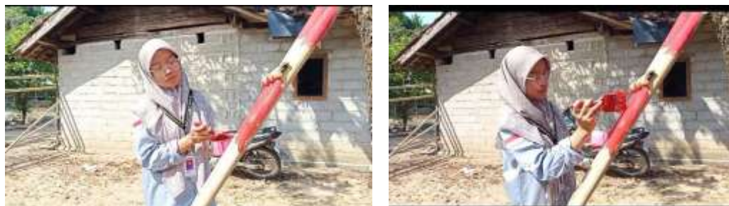
Gambar. 9 Pengecatan plang pembatas RT

Dalam proses ini Plang pembatas RT di tambahkan warna dengan menggunakan cat warna merah dan warna putih untuk menambah kesan cantik sesuai tema kemerdekaan Indonesia. Dalam proses pengecatan sampai pemasangan memerlukan waktu sekitar 3 hari untuk memastikan cat sudah benar benar kering dan siap untuk dipasang