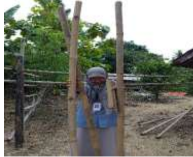
Gambar.4 Sebagian hasil bambu pilahan